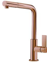
Mischbatterie Omega Plus Copper 8498 858