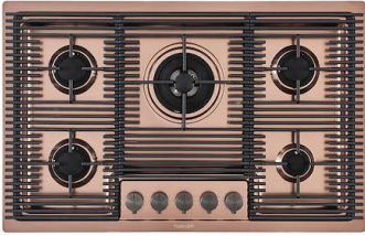
Kochfeld Milanello Copper 5F 7682 008