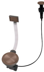
Automatischer Abfluss Space Push Copper 8407 122