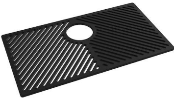
Gitter Black 8100 653